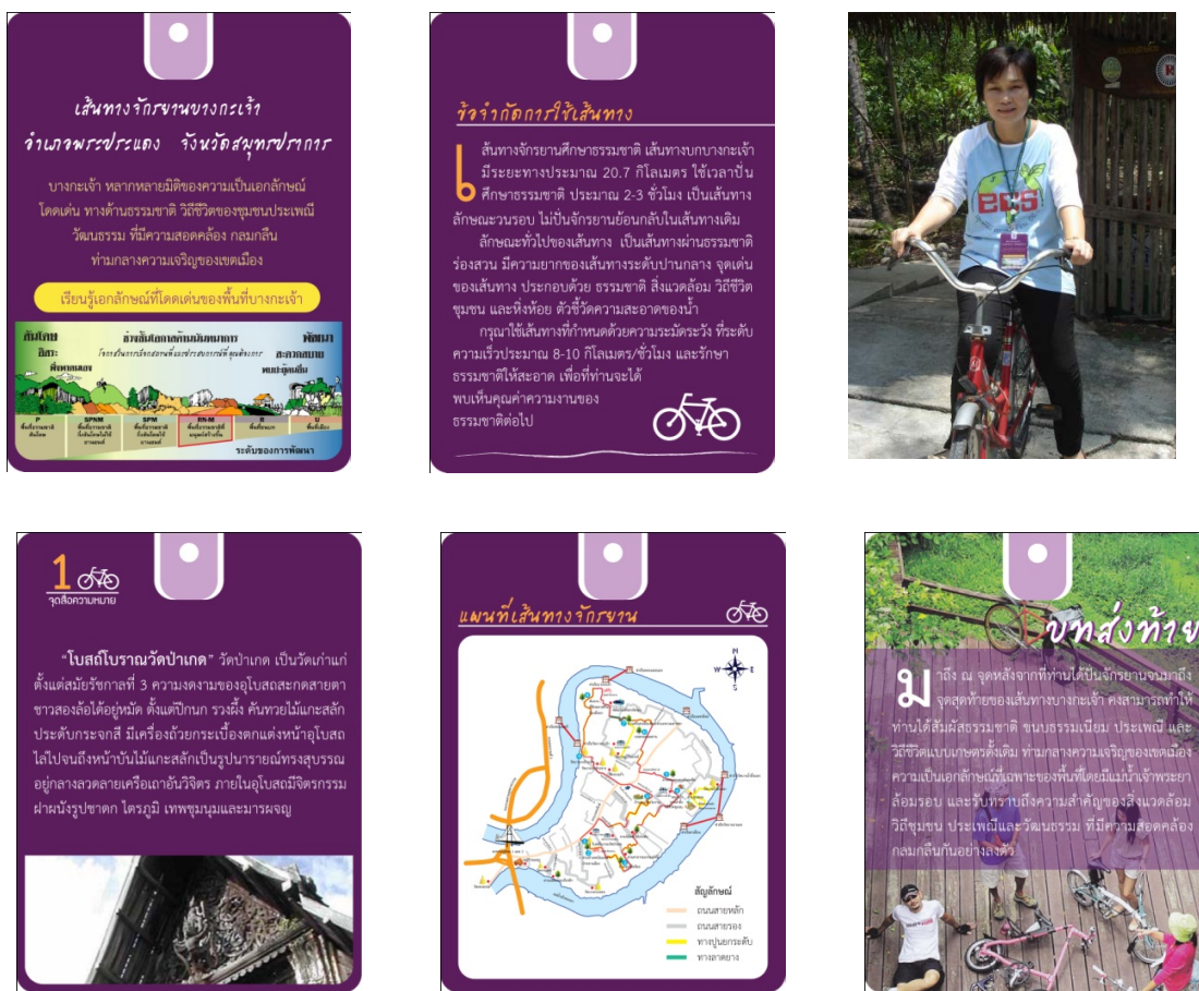
Figure 2 Samples of neck strap - interpretive leaflets for bicycling route at Bang Kachao.

สำหรับเส้นทางจักรยานสื่อความหมายบางกะเจ้า ระยะทาง 20.7 กิโลเมตร กำหนดเค้าโครงเรื่องในการสื่อความหมายคือ “บางกะเจ้า หลากหลายมิติของความเป็นเอกลักษณ์โดดเด่น ทางด้านธรรมชาติ วิถีชีวิตของชุมชนประเพณี วัฒนธรรม ที่มีความสอดคล้องกลมกลืนท่ามกลางความเจริญของเขตเมือง” มีจำนวน 10 จุดสื่อความหมาย โดยมีเป้าหมายเพื่อให้นักปั่นจักรยานสามารถรับทราบข้อมูลความรู้ และได้รับความเพลิดเพลินเกี่ยวกับพื้นที่ในด้านธรรมชาติ วิถีชีวิต ประเพณี วัฒนธรรมอันเป็นเอกลักษณ์โดดเด่นของพื้นที่บางกะเจ้า ซึ่งเนื้อหาของการสื่อความหมายในแต่ละจุด มีดังนี้