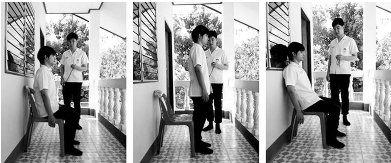
รูปที่ 1 การทดสอบลุกยืน 5 ครั้ง (five times sit-to-stand test)