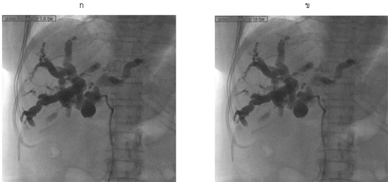
รูปที่ 2 แสดงภาพฟลูออโรสโคปีย์ของผู้ป่วยที่ได้รับการใส่สายระบายน้ำดีโดยถ่ายด้วยเทคนิค pulse fluoroscopy 7.5 (ก) และ 15 (ข) ภาพต่อวินาที

ต่อวินาทีโดยรังสีแพทย์ พบว่าภาพฟลูออโรสโคปีย์ทั้ง 2 ยอมรับได้ ค่าพารามิเตอร์และปริมาณรังสีในแต่ละเทคนิค (ตารางที่ 3) จากตารางที่ 3 แสดงให้เห็นว่าค่า kV, mAs และ fluoroscopy time ของแต่ละเทคนิคมีค่าใกล้เคียงกัน แต่ในขณะที่ปริมาณรังสี (air kerma และ DAP) มีความแตกต่างกันอย่างมีนัยสำคัญ