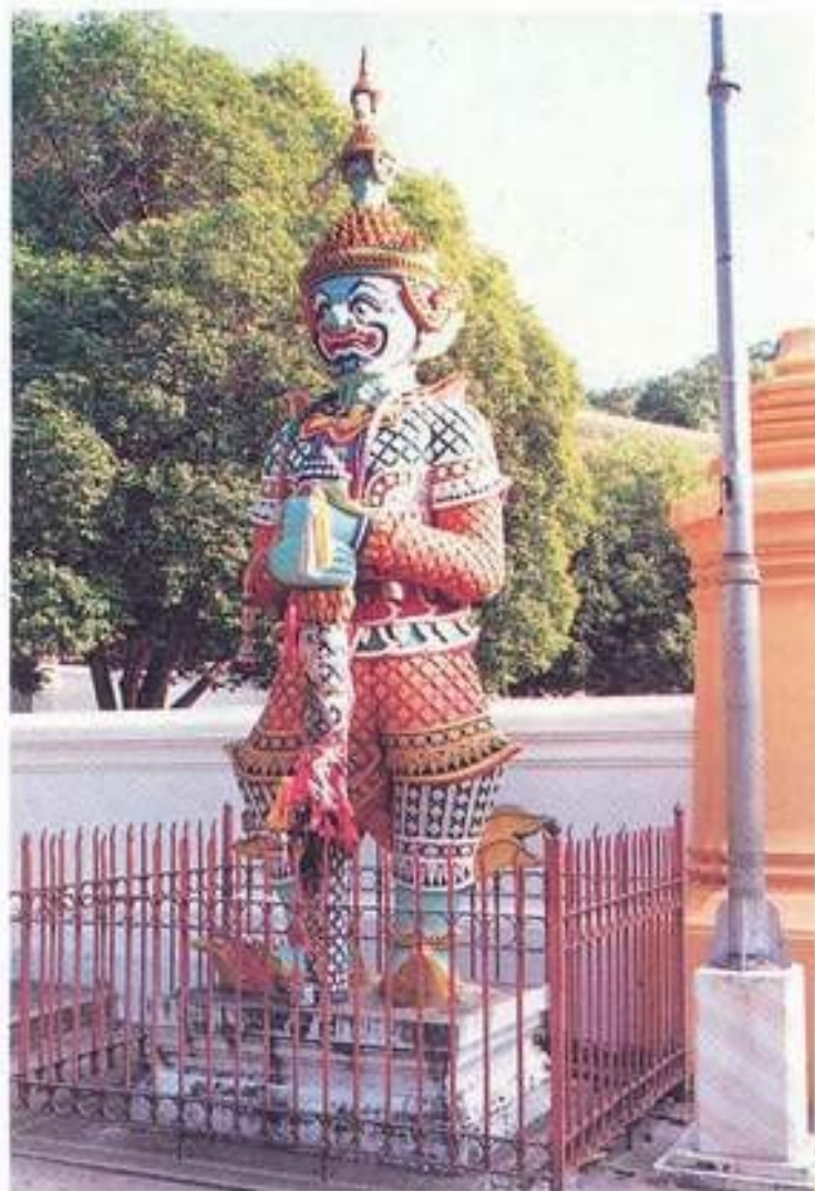
รูปที่ 27. บัณฑิตวารบาล (ทศกัณฐ์) วัดพระพุทธบาท จังหวัดสระบุรี