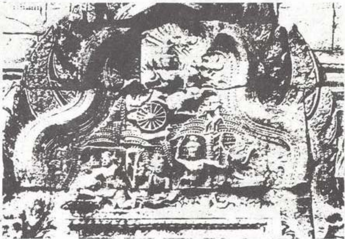
รูปที่ 8. ภาพสลักบนหน้าบันตอนทศกัณฐ์ลักนางสีดา ปราสาทหินพนมรุ้ง จังหวัดบุรีรัมย์