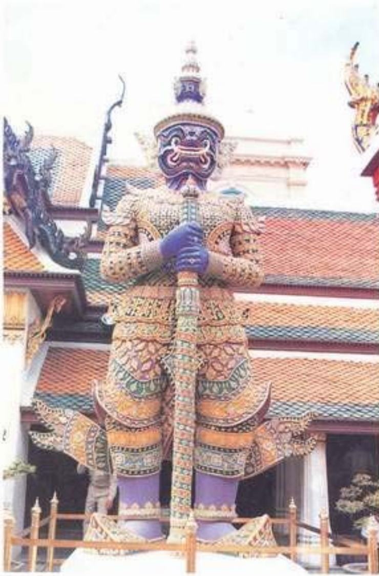
รูปที่ 25. ยักษ์ทวารบาล (อินทราชิต) วัดพระศรีรัตนศาสดาราม