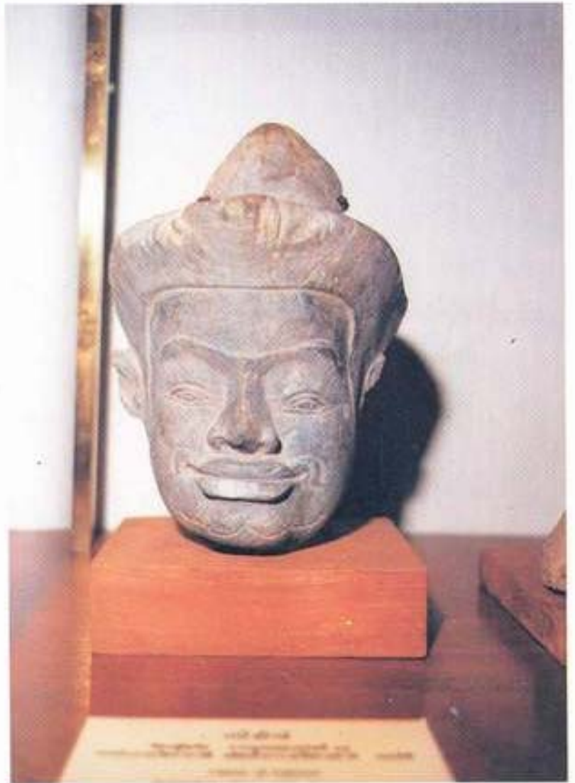
รูปที่ 22. เศียรยักษ์ทวารบาล หินชนวน จากพิพิธภัณฑ์สถานแห่งชาติรามคำแหง จังหวัดสุโขทัย