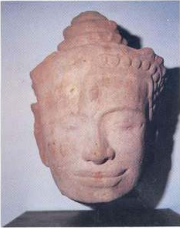
รูปที่ 21. เศียรยักษ์ทวารบาล จากวัดทราวาส จังหวัดลพบุรี