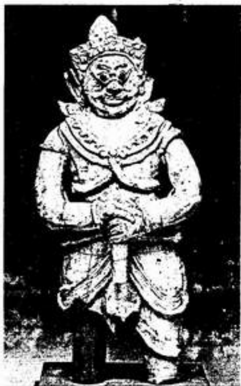
รูปที่ 11. บัณฑิตทวารบาล สังกโลก จากพิพิธภัณฑ์สถานแห่งชาติรามคำแหง จังหวัดสุโขทัย