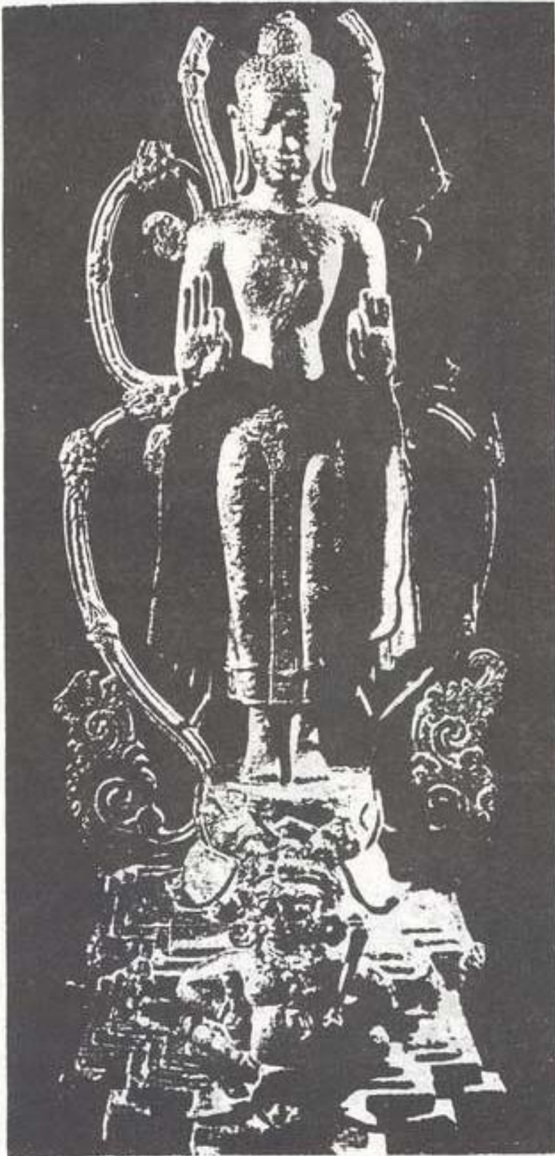
รูปที่ ๑. บัณฑิตอภินิหารของที่ฐานพระพุทธรูป อำเภอท่าศาลา จังหวัดนครศรีธรรมราช