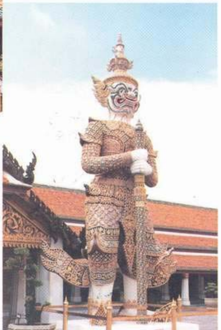
รูปที่ 26. ยักษ์ทวารบาล (สหัสเดชะ) วัดพระศรีรัตนศาสดาราม