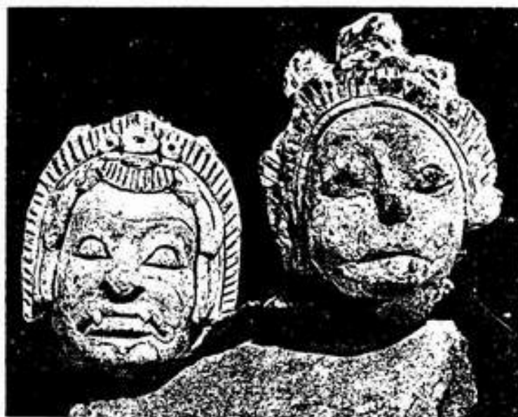
รูปที่ 14. เศียรบัณฑิต ปูนปั้น พบบริเวณสระโกสินารายณ์ จังหวัดราชบุรี