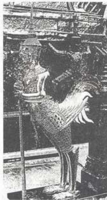
รูปที่ 18. อสูรยาญักษ์ วัดพระศรีรัตนศาสดาราม