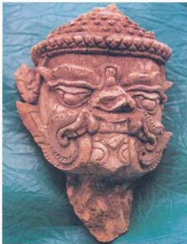
รูปที่ 32. เศียรชักษ์ ปูนปั้น วัดพระปทุมเจดีย์ จังหวัดนครปฐม