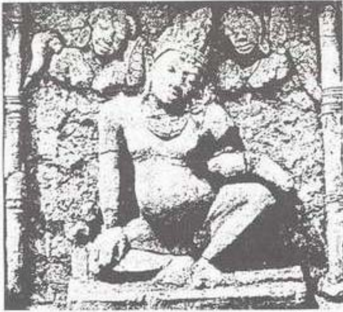
รูปที่ 1. ประติมากรรมรูปยักษ์และบริวาร ทำด้วยปูนปั้น ประดับที่ฐานเจดีย์จุลประโทน อำเภอเมือง จังหวัดนครปฐม ศิลปะแบบทวารวดี