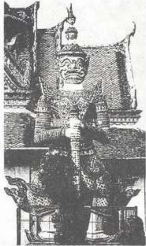
รูปที่ 16. บัณฑิตวารบาล (สหัสเดชะ) วัดอรุณราชวราราม