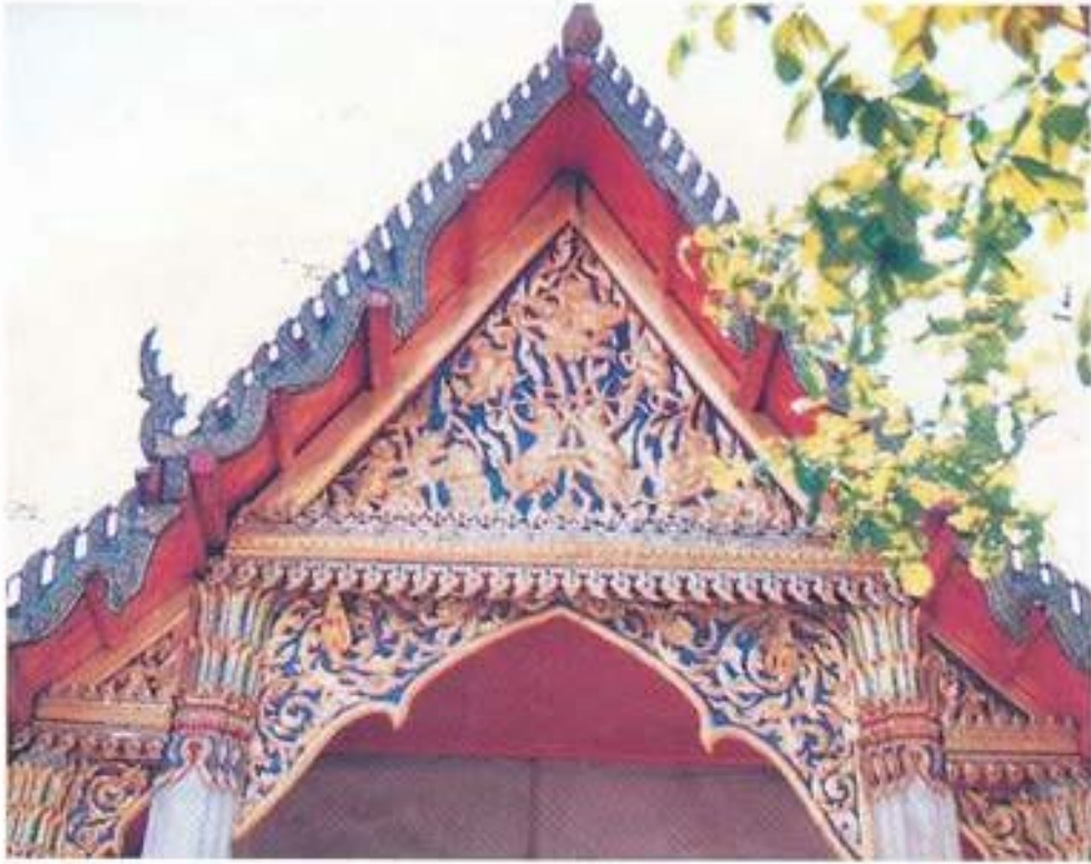
รูปที่ 33. บัณฑิตในภาพสลักไม้แกะเครื่องบนหน้าบันวิหารคต วัดพระเชตุพนวิมลมังคลาราม