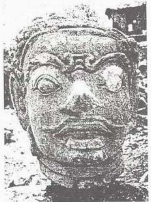
รูปที่ 4. เศียรยักษ์ พบบริเวณหน้าทำกาการไปรษณีย์ จังหวัดลพบุรี