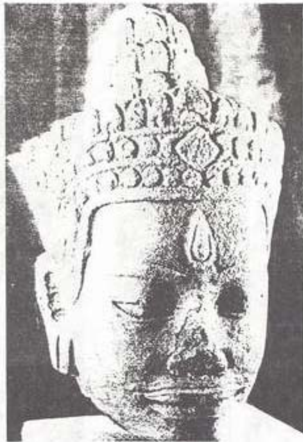
รูปที่ 7. เศียรทวารบาลจากถ้ำหินทางพระ อำเภอสามชุก จังหวัดสุพรรณบุรี