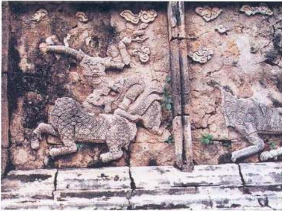
รูปที่ 31. ชักษ์ปูนปั้น วัดพระปทุมเจดีย์ จังหวัดนครปฐม