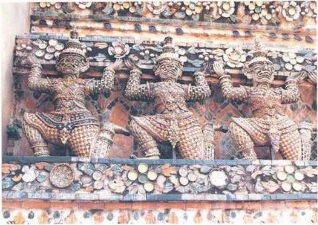
รูปที่ 29. บั๊กษ์แบกปูนปั้น วัดอรุณราชวราราม