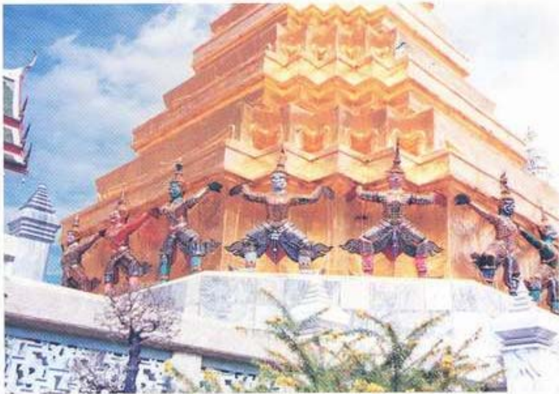
รูปที่ 30. บั๊กษ์แบก ปูนปั้น วัดพระศรีรัตนศาสดาราม