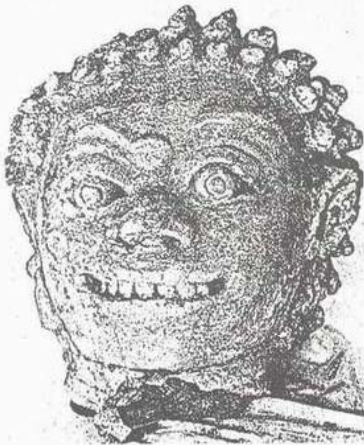
รูปที่ 3. เศียรยักษ์ปูนปั้น จากวัดพระเมรุ จังหวัดนครปฐม