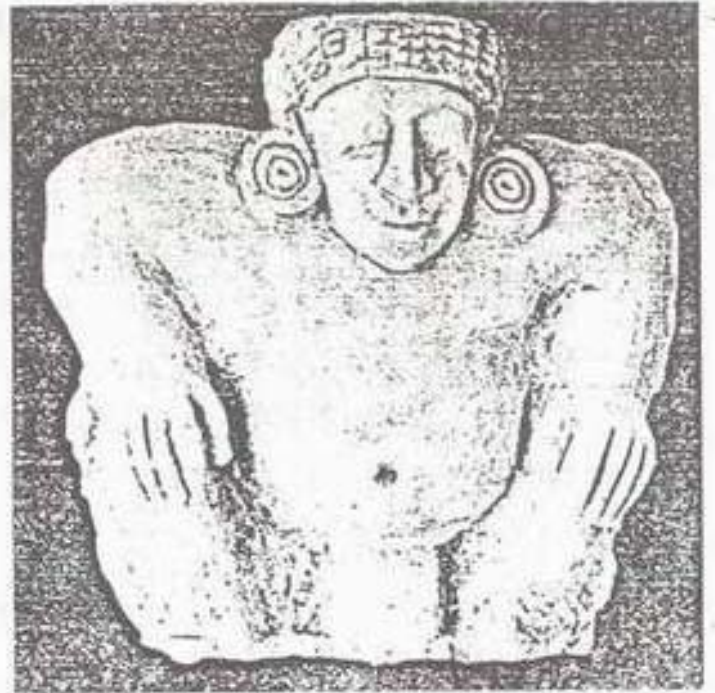
รูปที่ 2. ประติมากรรมรูปยักษ์ ทำด้วยปูนปั้นจากบ้านคูบัว จังหวัดราชบุรี ศิลปะแบบทวารวดี