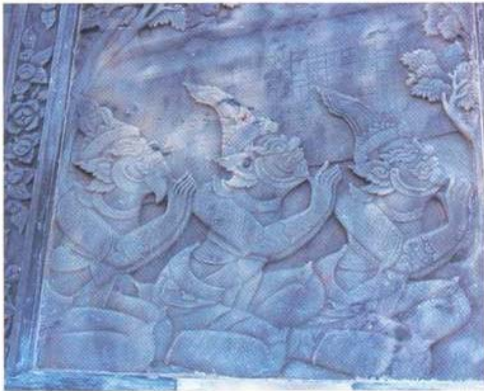
รูปที่ 34. บัณฑิตในภาพสลักนูนต่ำรอบผนังระเบียง วัดพระเชตุพนวิมลมังคลาราม