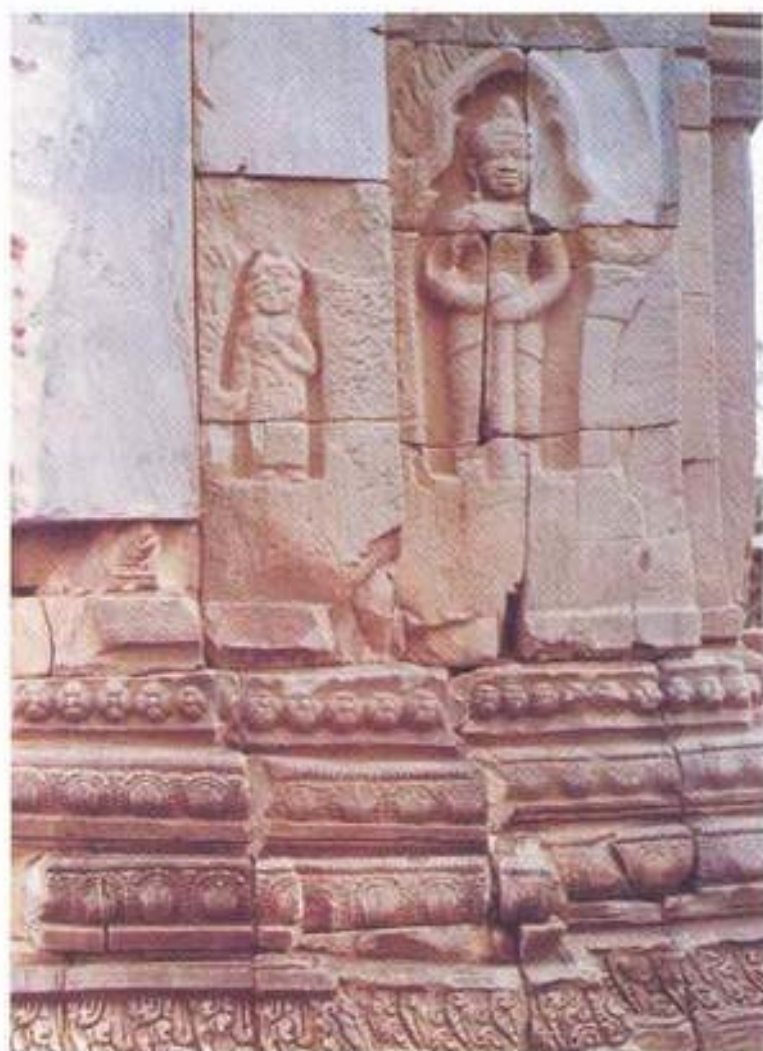
รูปที่ 23. ทวารบาลยืนตรง มือกุมกระบอง ปราสาทหินบ้านพลวง จังหวัดสุรินทร์