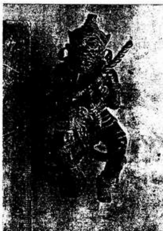
รูปที่ 12. บัณฑิตสาวัด จากวัดช้างล้อม อำเภอศรีสัชนาลัย จังหวัดสุโขทัย