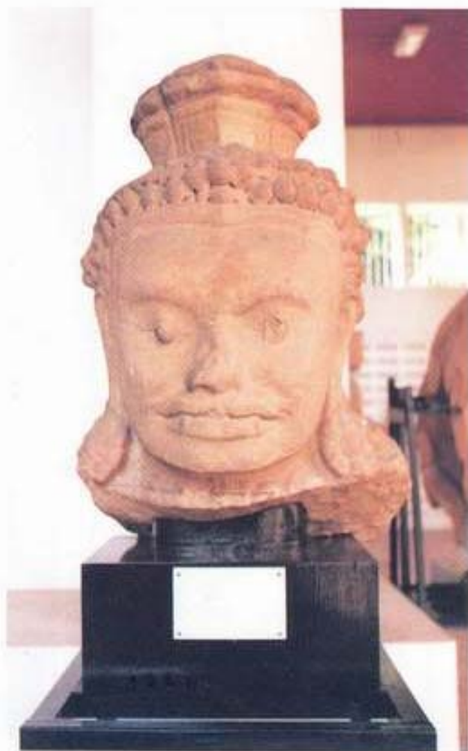
รูปที่ 20. เศียรยักษ์ทวารบาล จากวัดทราง จังหวัดลพบุรี ศิลปะเขมรแบบบาฮน