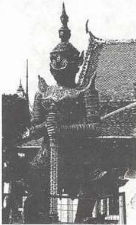
รูปที่ 15. บัณฑิตวารบาล (ทศกัณฐ์) วัดอรุณราชวราราม