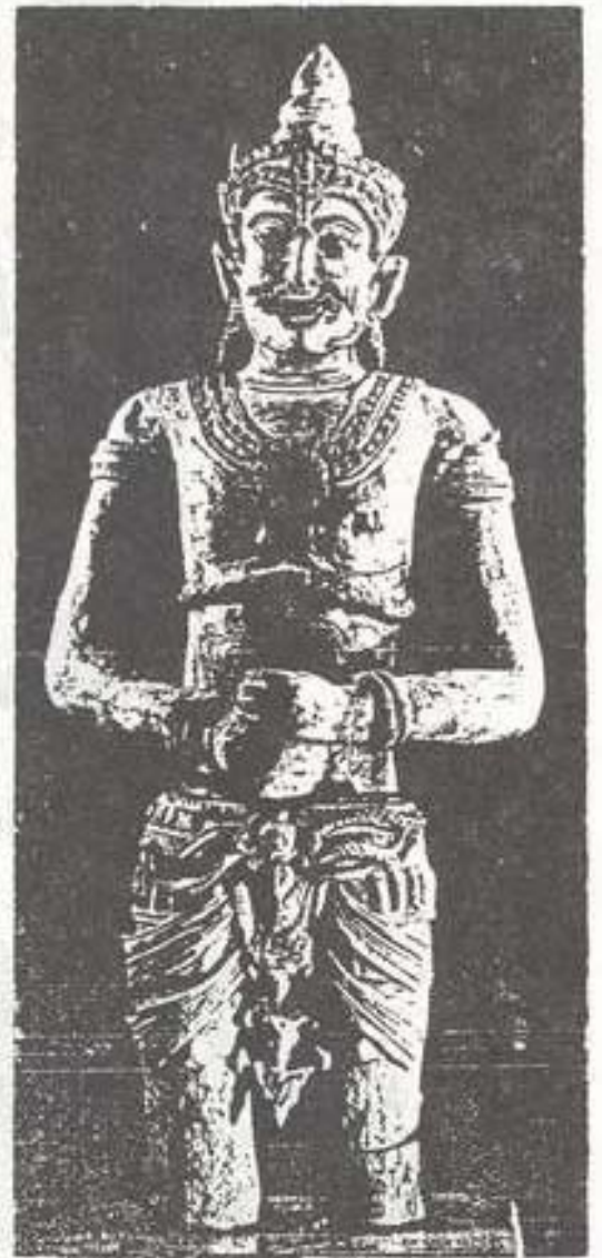
รูปที่ ๑๐. บัณฑิตอภินิหารของที่ฐานพระพุทธรูป อำเภอท่าศาลา จังหวัดนครศรีธรรมราช