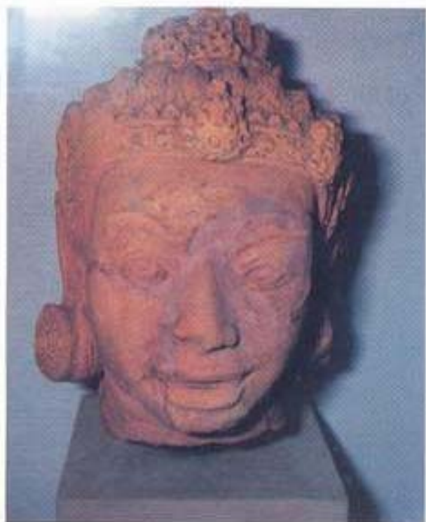
รูปที่ 19. ประติมากรรมรูปยักษ์ ทำด้วยดินเผา พบที่วัดพระงาม อำเภอเมือง จังหวัดนครปฐม ศิลปะแบบทวารวดี