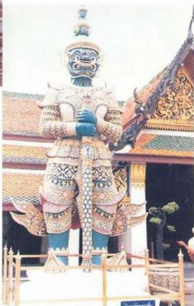
รูปที่ 24. ยักษ์ทวารบาล (ทศกัณฐ์) วัดพระศรีรัตนศาสดาราม