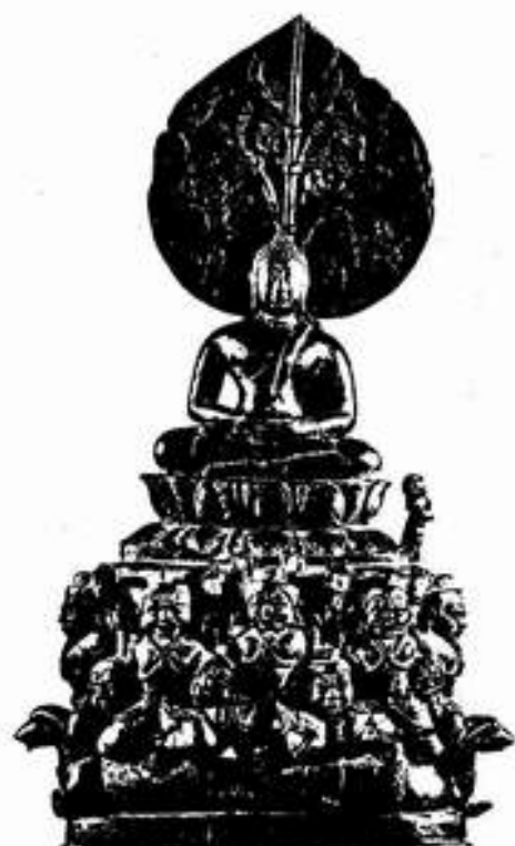
รูปที่ 13. บัณฑิตสาวัดที่ฐานพระพุทธรูป ในพิพิธภัณฑ์สถานแห่งชาติพระนคร