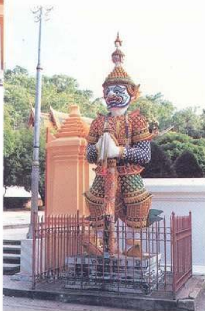
รูปที่ 28. บัณฑิตวารบาล (สหัสเดชะ) วัดพระพุทธบาท จังหวัดสระบุรี