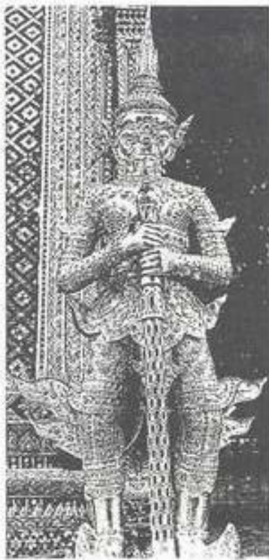
รูปที่ 17. บัณฑิตวารบาลบนปลายพลสังข์บันได วัดพระศรีรัตนศาสดาราม