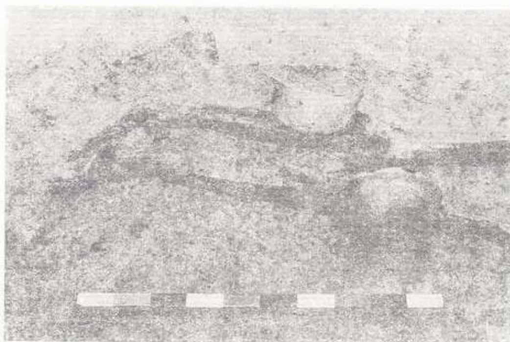
รูปที่ ๓ ภาพขยายของโครงกระดูกหมายเลข ๔๓ แสดงส่วนที่มัดตราสังบริเวณหัวเข่า และปลายเท้าซึ่งอยู่ชิดกัน และภาชนะดินเผาซึ่งวางอยู่บริเวณหัวเข่า

J. Natl. Res. Council Thailand, 1979, 11 (2)