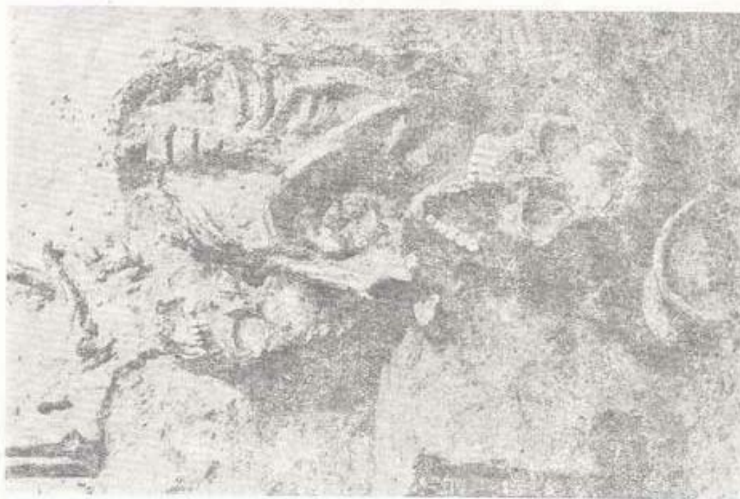
รูปที่ ๒ ภาพขยายโครงกระดูกหมายเลข ๔๓ และ ๔๔