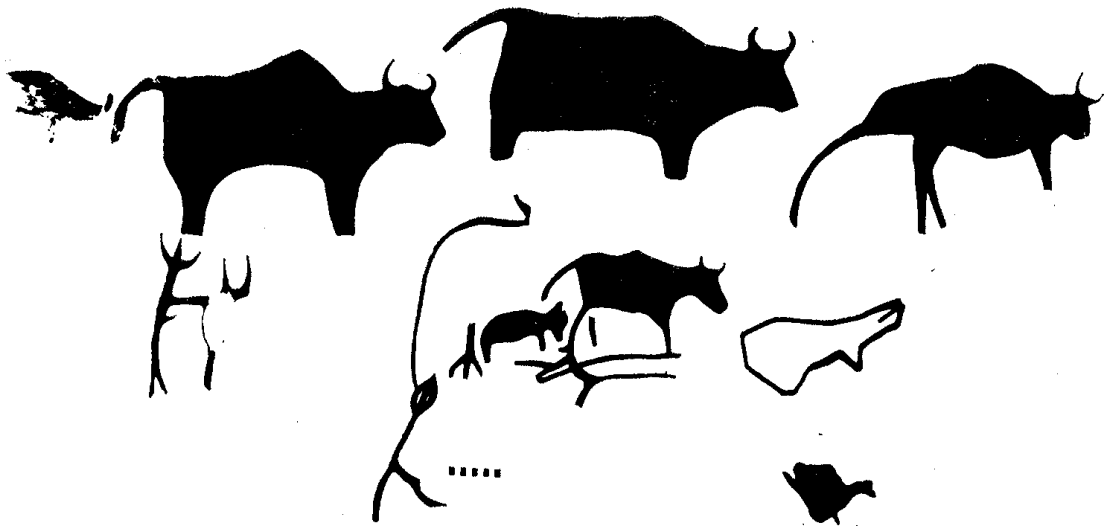
รูปที่ ๓ ภาพคัดลอกรูปวัว ที่ถ้ำวัว