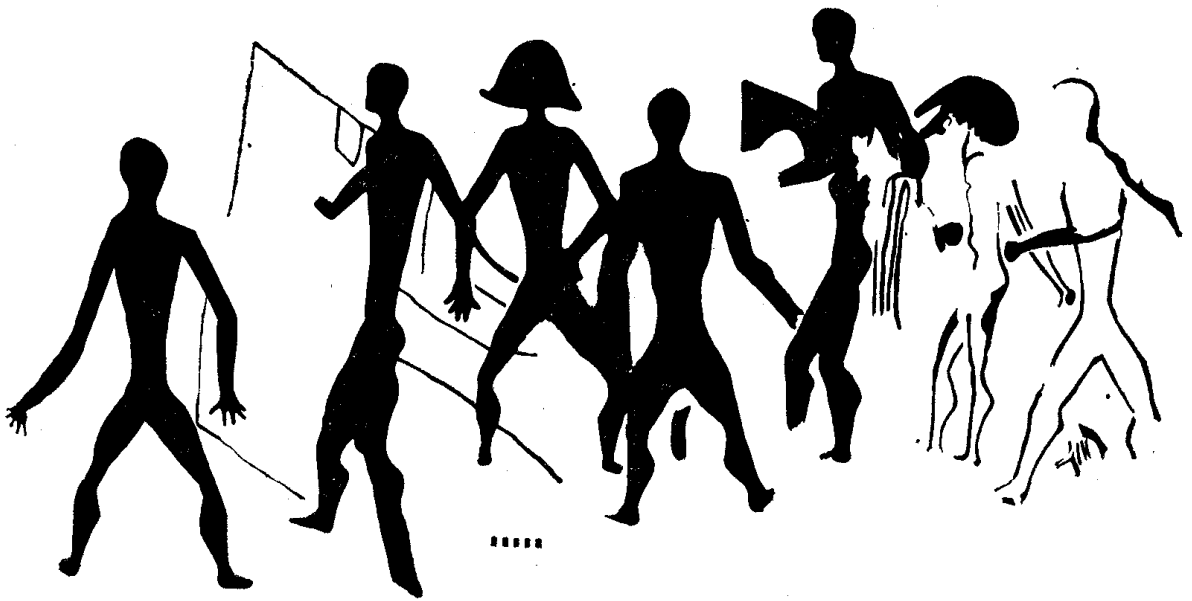
รูปที่ ๒ ภาพคัดลอกรูปคน ที่ถ้ำคน