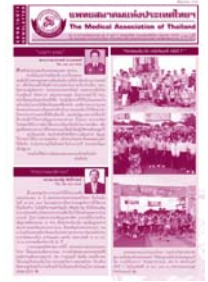
จดหมายข่าว มิถุนายน 2554