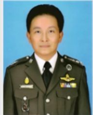
พล.ต.ท. จงเจตน์ อวจนพงษ์